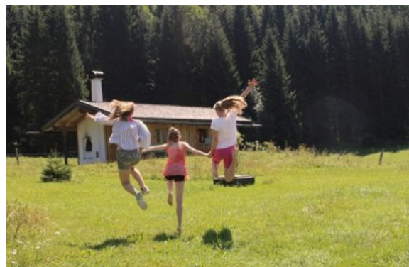
„Freiheit im Bild“ – Konfisommer 2018

30 Jahre ist es her, als im Herbst 1989 der Druck der Bevölkerung auf die Staatsführung der DDR immer größer wurde. Der Ruf nach Freiheit und Selbstbestimmung wurde immer lauter. Wie durch ein Wunder mündete das Ganze in einer friedlichen Revolution und als am 09. November 1989 völlig überraschend die Grenze geöffnet wurde und die Mauer geschleift wurde und die Menschen aus Ost- und Westberlin einander jubelnd in den Armen lagen, war der Weg frei geworden für die Wiedervereinigung Deutschlands. Die Freiheit erstritten und erkämpft. Es mag viele Gründe geben, dennoch ist es merkwürdig, dass von diesem Geist heute kaum noch etwas spürbar ist, zumindest in den 5 Bundesländern im Osten nicht. Freiheit bringt immer Risiken mit sich. Grenzen fallen und werden überschritten. Wo sind unsere Grenzen heute, auch und gerade in unseren eigenen Köpfen? Wo ist es nötig (Denk-) Fesseln abzustreifen? Wo lassen wir uns einlullen und geben unsere Freiheit geradezu freiwillig auf? Wichtige Fragen, denen wir uns immer wieder stellen müssen im Leben.