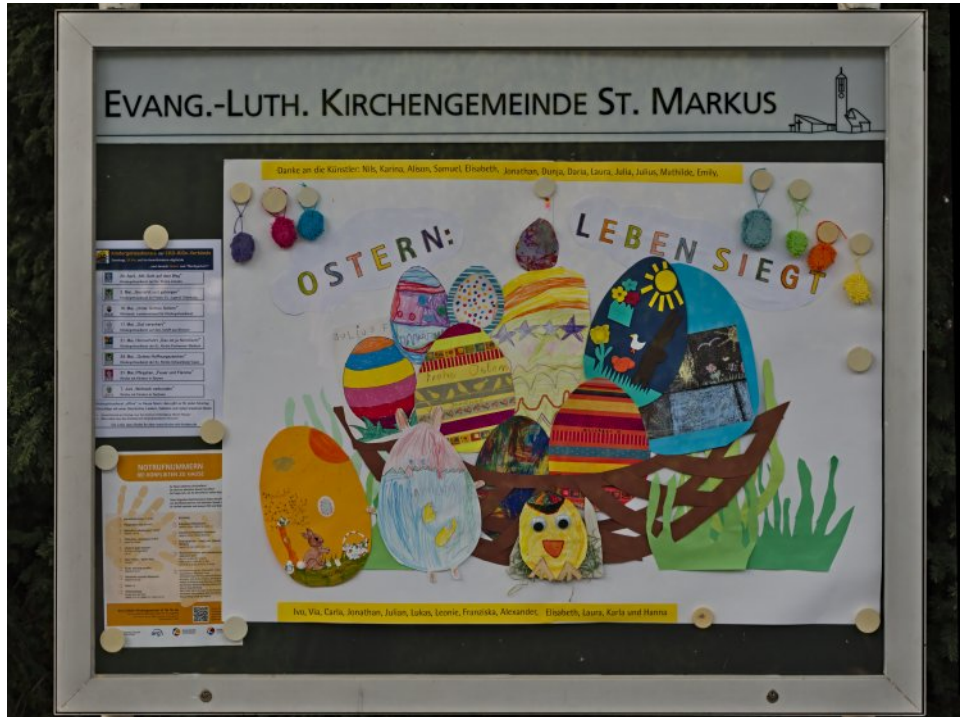
Der mit Hilfe der Oster-Bastel-Aktion gestaltete Schaukasten an der Münchener Straße

Das Team der Bücherei St. Markus freut sich, wieder für Sie bzw. Euch da zu sein. Seit 12. Mai 2020 hat die Bücherei wieder geöffnet. Bitte beachten Sie die bei einem Besuch die Abstandsregeln und vergessen Sie nicht Ihren Mundschutz.