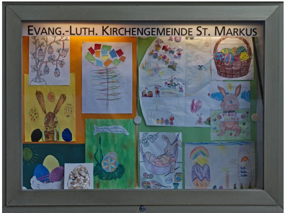
Der mit Hilfe der Oster-Bastel-Aktion gestaltete Schaukasten an der Kirche

Nach den neuen Regelungen im Datenschutz ist es in uns nicht mehr erlaubt, Seniorengeburtstage zu veröffentlichen. Wir bitten, das zu entschuldigen, und wünschen allen Geburtstagskinder auf diesem Weg alles Gute für Ihren Jubeltag und Gottes Segen für das kommende Lebensjahr.