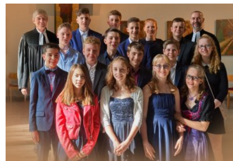
Konfirmaton am 29.04.2018