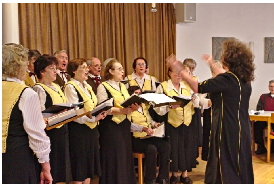
Chor der „Singenden Herzen“ am Seniorennachmittag im März

Unter markus-ingolstadt.de können die Bilder in voller Schönheit betrachtet werden.