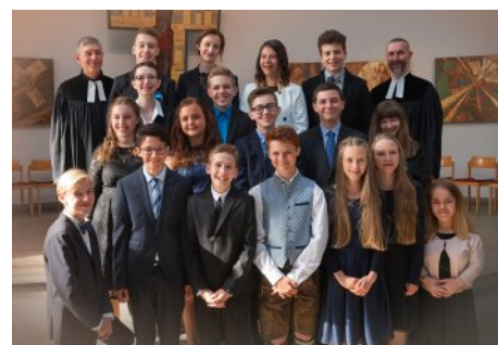
Konfirmaton am 06.05.2018

Unter markus-ingolstadt.de können die Bilder in voller Schönheit betrachtet werden.